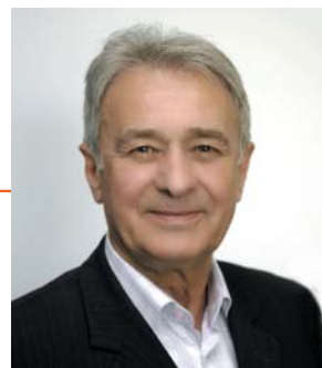
Bronisław Zielonka Aftermarket